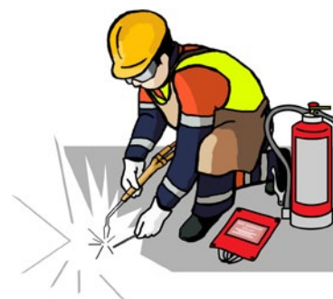
Rys. 2. Ruchome stanowisko spawalnicze