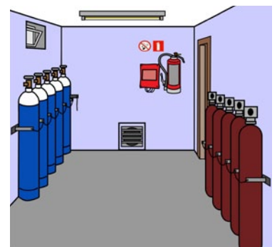
Rys. 3. Magazyn gazów technicznych