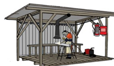
Rys. 1. Stanowisko spawalnicze na otwartej przestrzeni